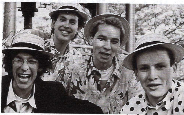
Männerchor „Norbert und die Feiglinge“

Seit einem Jahr begeistern „Norbert und die Feiglinge“ – eine Hamburger Gruppe, die vorwiegend a cappella singt – eine wachsende Fan-Gemeinde in Kneipen und Kabarett mit alten Liedern der Comedian Harmonists. Durchschlagenden Erfolg bescherte dem Quartett jetzt der „Manta“-Song, eine selbstkomponierte, humoristische Hymne, die