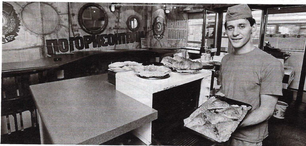
„Mec Iwan – Sovjet Imbiß“, Gastronom Scheub

„gefüllte Litauer“ (heiße Backwaren mit Zwiebeln) und für verwöhnte Gaumen „Blinis“ (Teigtaschen) mit Belugakaviar. Skeptischen Essern bietet die Gaststätte, deren Interieur einem sowjetischen U-Boot nachempfunden ist, aber auch gewohnte Hackfleischkost – Hamburger verkauft Scheub unter dem Tarnnamen „Mec Petersburger“.